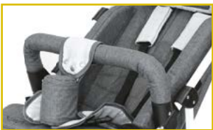
Barrera de seguridad