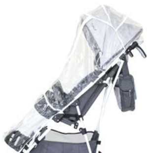
Protector para lluvia