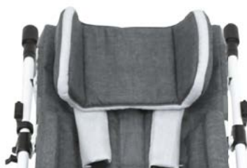
Apoyos laterales para cabeza