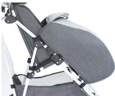
Saco de dormir