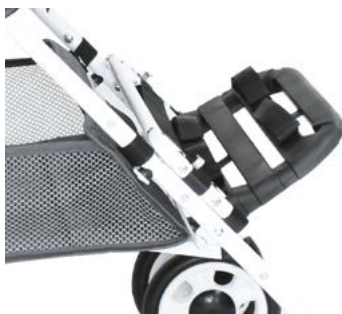
Reposapiés con cinchas