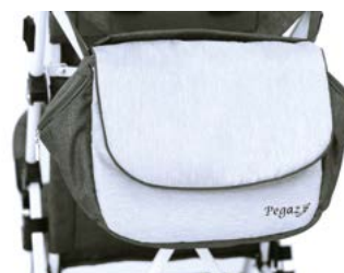
Bolsa para manillar