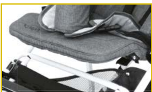
Sistema crece contigo