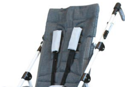
Cinturón de 5 puntos