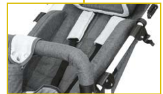
Respaldo y asiento ajustables y reclinables