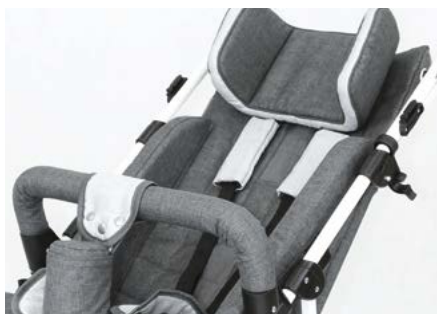
Apoyos laterales para tronco