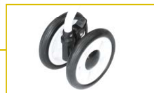
Ruedas delanteras y traseras con amortiguación