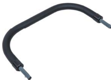
Barra de seguridad