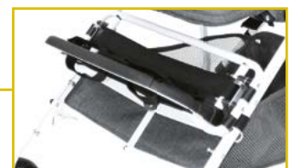
Reposapiés plegable y ajustable en altura